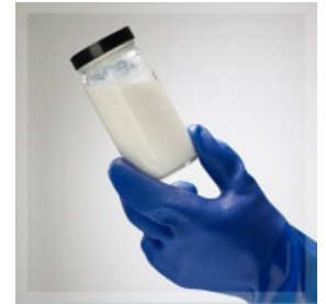
Exemple de 3-D Microemulsion

Pour une liste des polluants traitables au moyen du 3DME, voir le Guide du panel des polluants traitables .